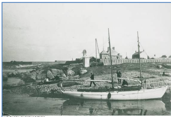
Le Ta-Tai, bateau des chentours du Muséum

Comme un livre d'histoire que l'on parcourrait en commençant par la dernière page, l'île Tatihou se dévoile au visiteur. Un zoom arrière sur les différentes périodes de sa vie s'affiche par le biais de photos sur les murs de l'ancien lazaret et le musée revient sur l'origine de l'émergence de cette île de granit, du big bang à son occupation par l'homme de Néanderthal jusqu'aux visiteurs d'aujourd'hui en passant